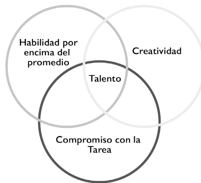
Figura 1. Modelo de los tres anillos para explicar el talento (Renzulli, 2005).

Además, Renzulli es conocido por proponer dos tipos de talento, el “talento escolar” y el “talento creativo-productivo”. El primero se refiere al estudiante que destaca más en la escuela, aquel que obtiene excelentes notas en pruebas de aprendizaje. Por su parte, el talento creativo-productivo no tiene que ver específicamente con pruebas escolares, sino que se refiere a aquellos sujetos que son excelentes productores del conocimiento; mientras que los escolares son consumidores superiores del conocimiento (Véase la Figura 2).